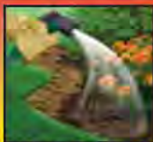
Water Product Into Soil